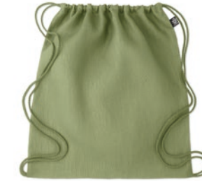
Naima Bag MO6163 Beutel mit Kordelzug. 100% Hanfgewebe. 200 g/m 2 .