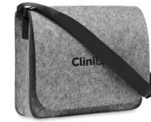
Baglo MO6186 Umhängetasche aus RPET-Filz. Klettverschluss und Umhängegurt. Bietet Platz für einen 15" Laptop.