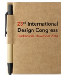
Cartopad MO7626 Mini-Notizblock inkl. Mini-Kugelschreiber, 80 Blatt liniert aus recycelten Materialien. Blaue Tinte.