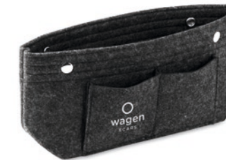
Nazer MO6335 RPET-Filz-Organizer mit 5 Innen- und 3 Außenfächern.