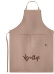
Naima Apron MO6164 Küchenschürze mit verstellbarem Nackenband und 2 Fronttaschen. 100% Hanfgewebe. 200 g/m 2 .