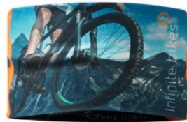
MH3101 MH3101 100% RPET (140g/m²). Maße ca.: 25x11cm