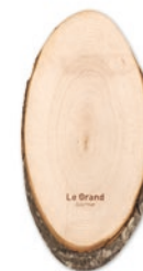
Ellwood Runda MO8862 Ovales Schneidebrett aus Holz. Naturbelassen mit Rinde.