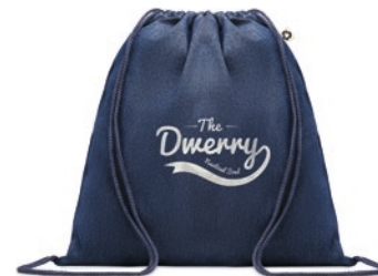
Style Bag MO6422

2 tone (recycelte Baumwolle und recyceltes Polyester) Einkaufstasche mit Kordelzug und langen Henkeln. ca. 140 gr/m 2 . Dieser Artikel kann nach dem Bedrucken schrumpfen.