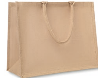
Brick Lane MO8965

Einkaufs- oder Strandtasche aus laminiertem Jute. Kurze Tragegriffe aus Baumwolle.