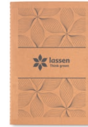
Mid Paper Book MO9867

DIN A5 Notizbuch mit Pappcover (250g/m 2 ). 40 Blatt genäht, 70g recyceltes Papier.