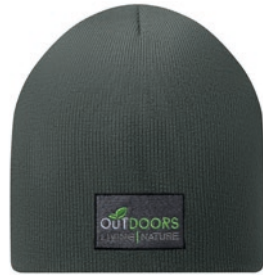
MW1101 MW1101 Doppellagige Beanie. 100% RPET. Einheitsgröße (passt meistens).