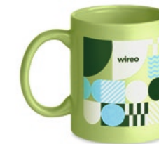
Dublin Tone MO6208

Kaffeetasse aus Keramik. Füllmenge: 300 ml. Nur Keramik-Transferdruck ist spülmaschinengeeignet. Verpackt in einem Karton.