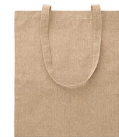
Cottonel Duo MO9424

Denim Einkaufstasche mit langen Tragegriffen. 50% recycelter Baumwoll-Denim und 50% Baumwolle. 250 g/m 2 .