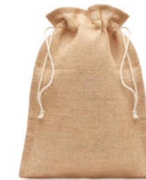
Jute Medium MO9929

Große Jute Tasche mit Kordelzug. Maße ca. 30 x 47cm.