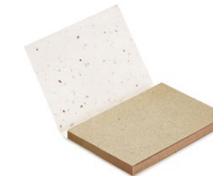
Grow Me MO6234

Notizzettel-Set mit 25 Klebezetteln aus Graspapier und 3 farbigen Markerblöcken. Das Cover ist mit Samenpapier beschichtet. Nach Gebrauch kann das Cover eingepflanzt werden und es wachsen Wildblumen. Hergestellt in der EU.