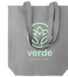
Naima Tote MO6162 Shopping Tasche mit langen Tragegriffen. 100% Hanfgewebe. 200 g/m 2 .