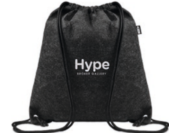
Indico MO6463 Beutel mit Kordelzug aus RPET-Filz mit Kordeln aus Polyester.