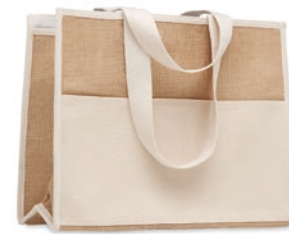
Campo De Geli MO6160

Shopping Tasche aus Jute mit langen Tragegriffen, laminiert und mit Klettverschluss. Vorderseite mit Taschen aus Canvas und Baumwollgewebe.