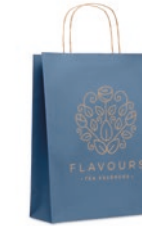
Paper Tone M MO6173

DIN A6 Notizbuch mit Pappcover (250g/m 2 ). 40 Blatt genäht, 70g recyceltes Papier.