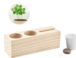
Thila MO6408 Schreibtisch-Organizer aus Holz mit Stift- und Smartphone-Halter sowie Pflanztopf mit Klee-Samen.