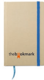
Evernote MO7431 DIN A6 Notizbuch aus recyceltem Material. 96 Blatt Blankopapier und farbiges Lesebändchen sowie elastisches Verschlussband.