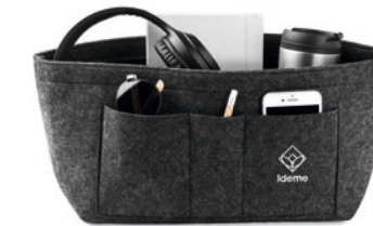
Nizer MO6334 RPET-Filz-Organizer mit 2 Innen- und 4 Außenfächern.