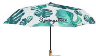
MU2006 MU2006 21" 3dach gefalteter Regenschirm mit Holzgriff.