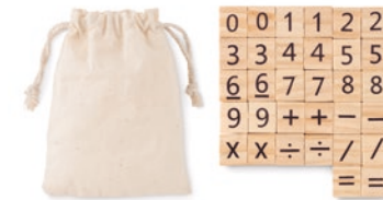
Educount MO6398 Lernspiel zum Zählen aus Holz. Enthält 32 Teile. Lieferung in einem Beutel aus Baumwolle.