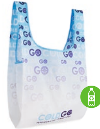
MB1111 Faltbare Einkaufstasche mit Innenfach. 100% recyceltes PET. Maße: 41x63cm.