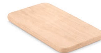
Petit Ellwood MO8860 Kleines Schneidebrett aus Holz.