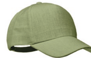
Naima Cap MO6176 Baseball Kappe. 5 Paneele. 100% Hanfgewebe 370g/m 2 . Messing-Schnalle mit Einstecklasche. Fünf farblich abgestimmte, umsticker Belüftungslöcher. Größe 7 1/4.