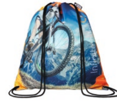
MB3111 RPET Beutel mit Kordelzug: 36x40cm