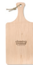
Ellwood Lux MO9624 Schneidebrett mit Griff und Schnur. Erle-Holz aus der EU.