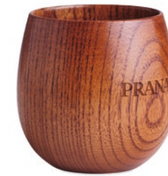
Ovalis MO6553 Becher aus Eichenholz. Füllmenge: 250 ml.