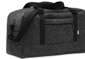
Indico Bag MO6457 Weekender-Tasche aus RPET-Filz. Fronttasche mit Reißverschluss, Griffe aus Canvas und abnehmbarer, verstellbarer Schultergurt. Auch ideal als Sporttasche.