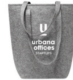
Taslo MO6185 Shopping Tasche aus RPET-Filz mit langen Tragegriffen und Bodenfalte.