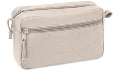
Naima Cosmetic MO6165 Kosmetiktasche mit Zweibege-Reißverschluss. 100% Hanfgewebe. 200 g/m 2 .