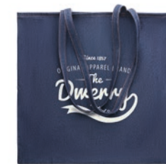
Style Tote MO6420

Denim Beutel mit Kordelzug. 50% recycelter Baumwoll-Denim und 50% Baumwolle. 250 g/m 2 .