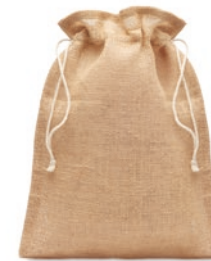
Jute Small MO9928

Medium Jute Tasche mit Kordelzug. Maße ca. 25 x 32cm.