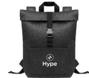
Indico Pack MO6456 Rucksack aus RPET-Filz mit Laptop-Fach. Reißverschluss tasche auf der Vorderseite, Verschlussgurt aus Baumwolle.