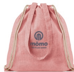
Moira Duo MO9603

2 tone (recycelte Baumwolle und recyceltes Polyester) Einkaufstasche mit Kordelzug und langen Henkeln. ca. 140 gr/m 2 . Dieser Artikel kann nach dem Bedrucken schrumpfen.