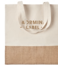
India Tote MO9518

Shopping Tasche aus Jute mit langen Tragegriffen, laminiert und mit Klettverschluss. Vorderseite mit Taschen aus Canvas und Baumwollgewebe.