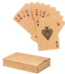
Aruba + MO6201 Klassische Spielkarten in einer Pappschachtel. Alles aus recyceltem Papier. 54 Karten.