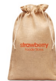
Jute Large MO9930

Umweltfreundliche Einkaufstasche aus Jute. Mit Griffen aus Baumwolle.