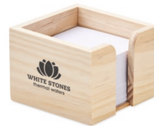
Sequoia MO6482 Notizzettelhalter in Würfelform. Bambus. 600 Blatt, weißes 70 g/m 2 Papier, Maße: 9x9 cm.