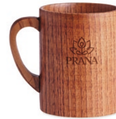
Travis MO6363 Becher aus Eichenholz. Füllmenge: 280 ml.