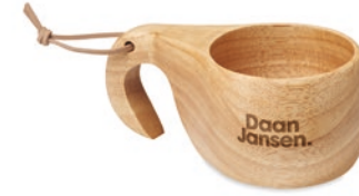
Indy MO6368 Outdoor-Tasse aus Eichenholz mit Aufhänger. Füllmenge: 120 ml.