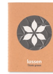
Mini Paper Book MO9868

DIN A5 Notizbuch mit Pappcover (250g/m 2 ). 40 Blatt genäht, 70g recyceltes Papier.