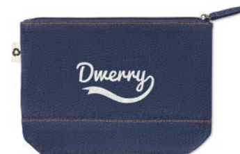
Style Pouch MO6421

2 tone (recycelte Baumwolle und recyceltes Polyester) Einkaufstasche mit langen Tragegriffen. ca. 140 gr/m 2 . Dieser Artikel kann nach dem Bedrucken schrumpfen.