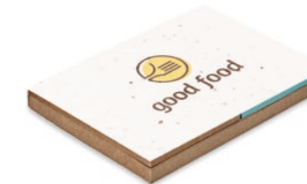
Grow Me MO6235

Notizbuch mit Deckel aus Bambus. 70 Blatt recyceltes Papier. Mit passendem Kugelschreiber aus Bambus, Spitze und Clip aus ABS.