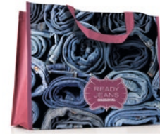
MO4070 Taschen im Querformat Maße: 36x32x12cm.